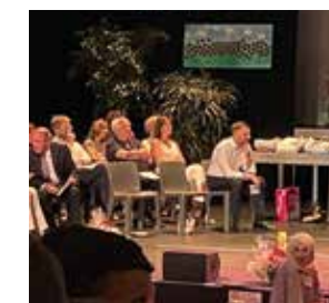
Prix du concours des écoles fleuries.