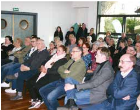
ÉRIC KOEBERLÉ Maire de Bavilliers