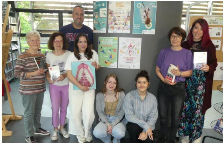
Les chevilles ouvrières de la foire et des bénévoles.

L'Est Républicain - 19 juin 2024 à 19:19 - Temps de lecture : 2 min