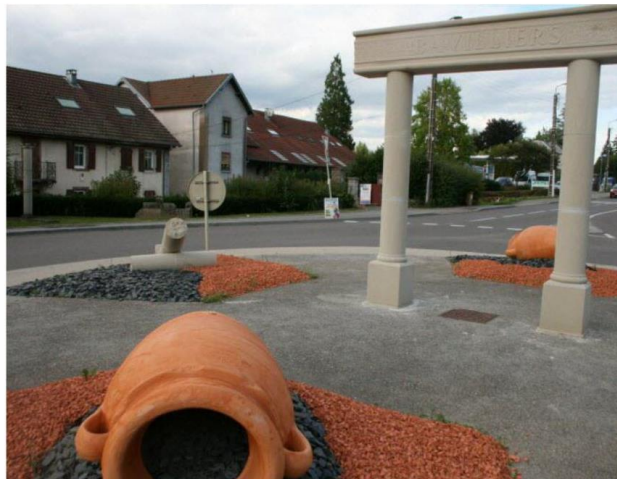
Un rond-point à la décoration gallo-romaine.

L'Est Républicain – 28 août 2025 à 17:59 – Temps de lecture : 2 min