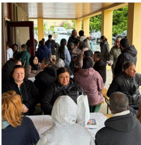
La réunion s'est déroulée sous le hall de l'immeuble rue de Delémont.

L'Est Républicain - 20 mai 2026 à 19:48 - Temps de lecture : 2 min