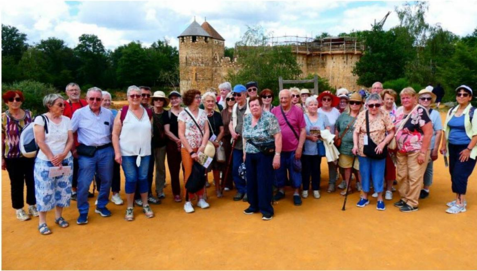
Les visiteurs sur un site majeur, celui de Guedelon.

L'Est Républicain – 12 juin 2026 à 21:17 – Temps de lecture : 1 min